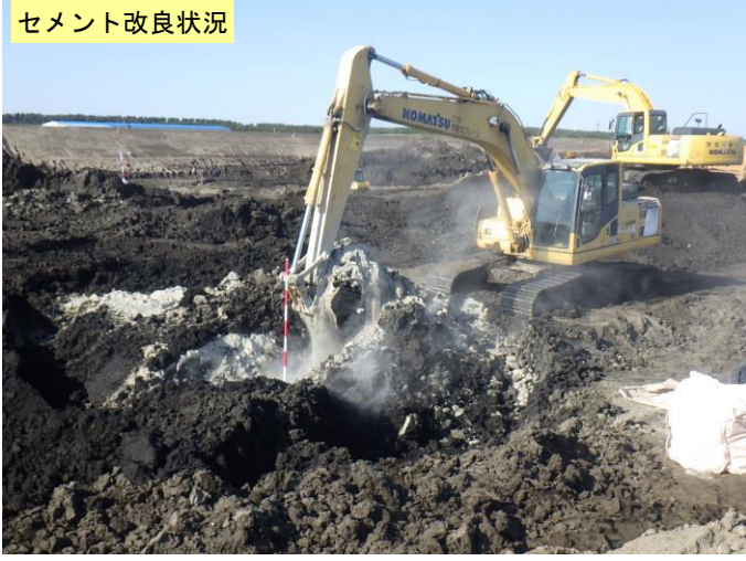
セメント改良状況